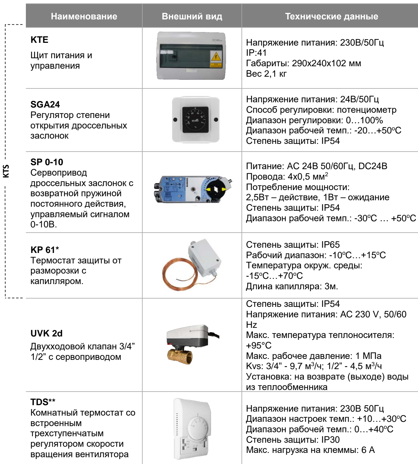
Таблица 1. Составные элементы системы управления

К смесительным камерам КС применяется система управления KTS, которая обеспечивает питание, управление и защиту для одного тепловентилятора, работающего совместно со смесительной камерой.